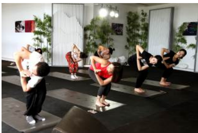
王府中環携手 PURE Yoga 打造的晨间瑜伽工作坊，吸引了众多瑜伽爱好者踊跃参与，学员们在专业瑜伽老师的引导下，通过瑜伽伸展、呼吸练习与冥想放松身心。